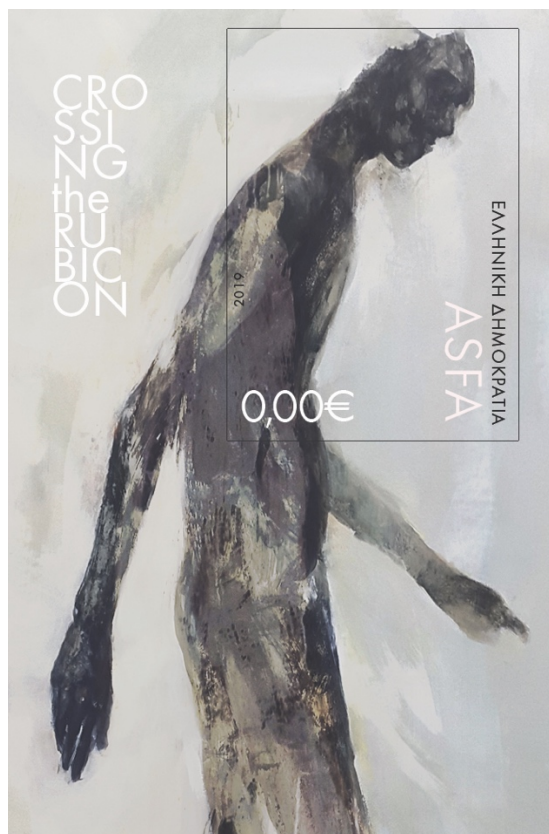
4 Νο2 Feullet Ζωγραφική Μεικτή Τεχνική