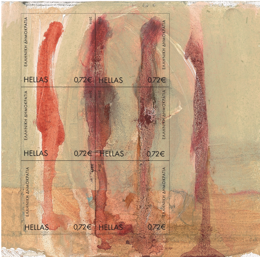
1 Feullet Ζωγραφική Λάδι σε Καμβά